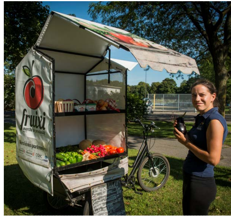
Fruixi: vente itinérante nécessitant un permis d'occupation du domaine public

Justification : objectifs d'un plan; achat et emploi locaux; période de vente limitée; investissement de la Ville dans le projet; etc.