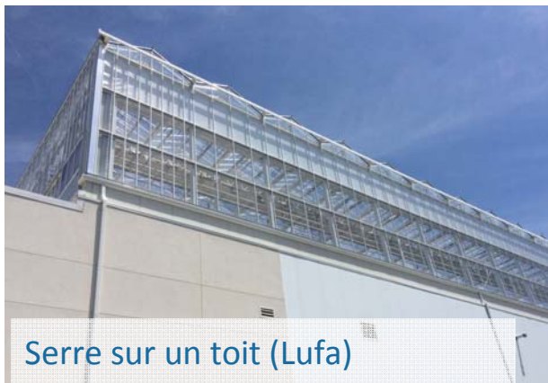
Serre sur un toit (Lufa)